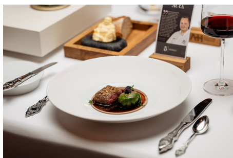
Restaurant „Aura“