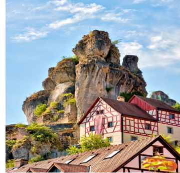
Adobe/stock © reimax 16

erwartet, sondern auch kulinarisch mit einem großartigen Degustationsmenü verwöhnt. Freuen Sie sich auf ein besonderes Genusserlebnis für alle Sinne!