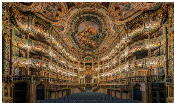
Markgräfliches Opernhaus